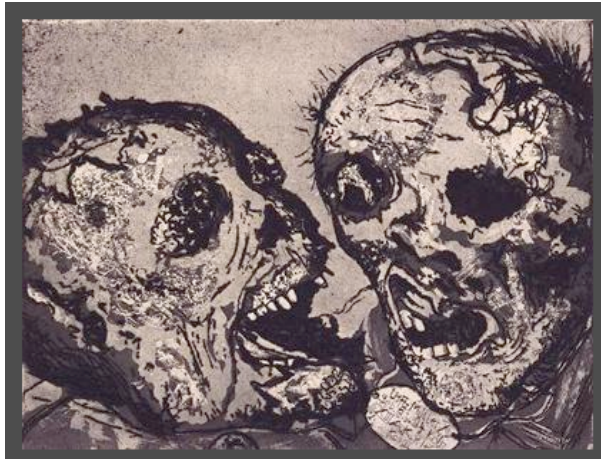
Mort devant la position de Tahure